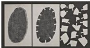
Teoria delle catastrofi, 1991, gessetto e polvere di carbone su carta 70x128,5 cm